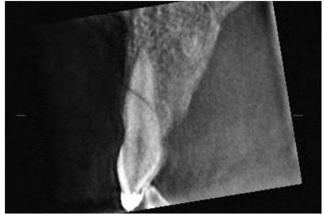
Abb. 2 Typisch schräger Verlauf des Bruchspalts bei Wurzelfrakturen