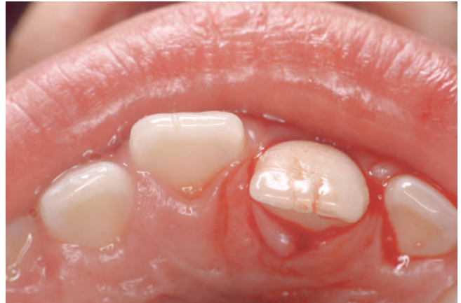
Abb. 4 Palatale Dislokation Zahn 21