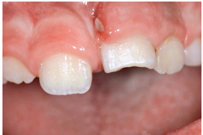
Abb. 6 Intrusion Zahn 21 mit begleitender Kronenfraktur

verlaufs ohnehin nicht exakt zuzuordnen und ebenfalls therapeutisch irrelevant (Abb. 2). Therapeutisch und prognostisch relevant hingegen ist die Unterteilung in „Wurzelfraktur mit oder ohne Dislokation der Fragmente“ und „Wurzelfraktur mit Erhalt oder Verlust der Pulpasensibilität“ (Tab. 1).