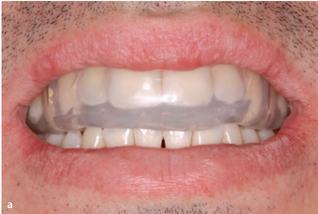
Abb. 8a bis c Professioneller, vom Zahnarzt in Zusammenarbeit mit einem zertifizierten Zahntechniker angefertigter Zahnschutz. Ansicht von bukkal (a), okklusal (b) und lateral (c)