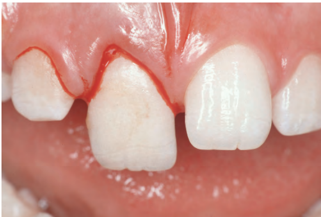
Abb. 5 Extrusion Zahn 11