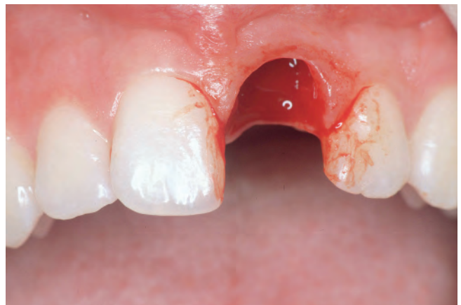
Abb. 7 Avulsion Zahn 21

Auch die Dislokationsverletzungen werden in „klassische“ Verletzungsarten unterteilt (Tab. 2, Abb. 3 bis 7). Insbesondere im deutschsprachigen Raum sind teilweise noch immer antiquierte und/oder falsche Synonyme im Gebrauch. Begriffe wie Subluxation, Totalluxation oder Exartikulation stammen aus der Gelenklehre und haben nichts mit der parodontalen Verankerung zu tun. Neue deutsche Wortkreationen wie Eluxation werden international nicht verstanden und sind daher überflüssig. All diese falschen, veralteten