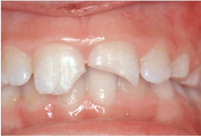
Abb. 1 Schmelzfraktur Zahn 11 distal, Schmelz-Dentin-Fraktur Zahn 11 mesial und Fraktur mit Pulpaexposition Zahn 21 (Pulpa bereits abgedeckt)