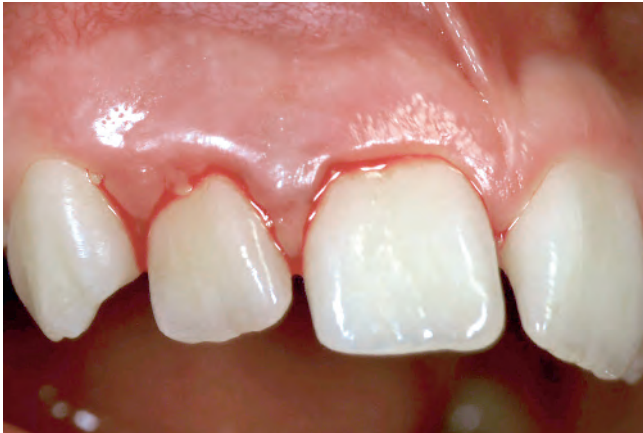
Abb. 3 Lockerung der Zähne 11 und 12