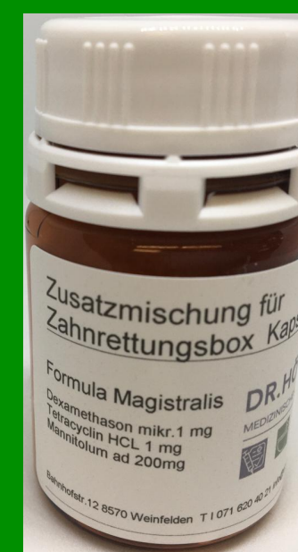
Zusatzmedikamente für Avulsion

Zusatzmischung für die Zahnrettungsbox, Emdogain