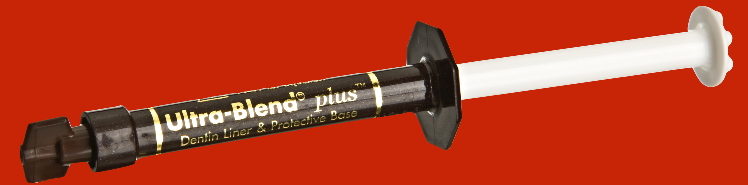
Kalziumhydroxidzement z.B. Ultrablend Plus, Calcimol LC, Dycal