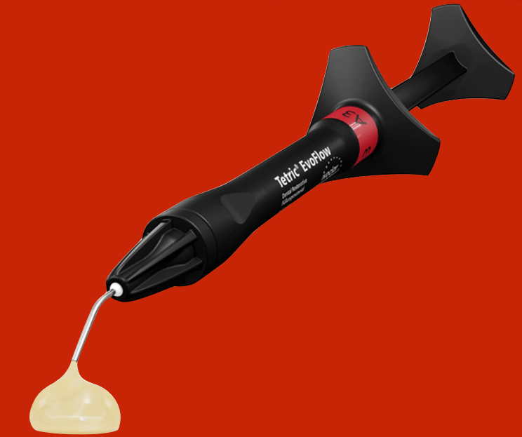
Fluoreszierendes flowable Komposit